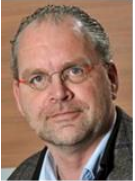
Theo Meskers wethouder Hollands Kroon