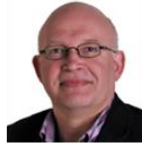
Henk Staghouter gedeputeerde Groningen Waddenprovincies