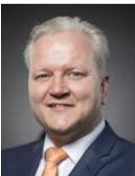
Kees Visser wethouder Den Helder